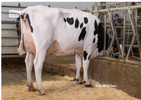
PROGENESIS TOPNOTCH MACIE THIRD DAM