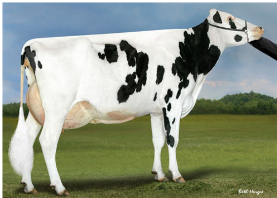
PROGENESIS DUKE MELEE FOURTH DAM